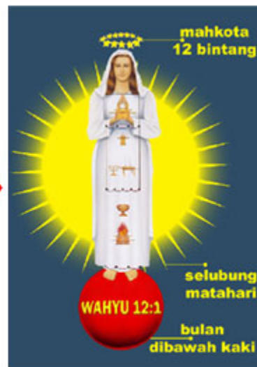
MEMPELAI WANITA (KENYATAAN)